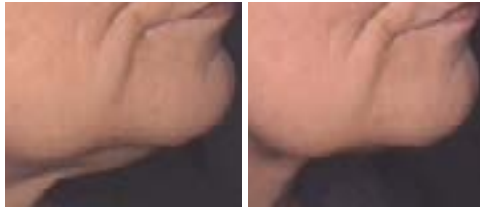
TO ERSTE ANWENDUNG